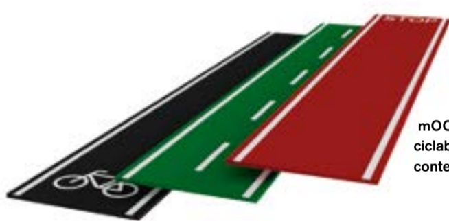
mOOve prevede dei tappeti ciclabili adattabili in base al contesto e ai bisogni della città