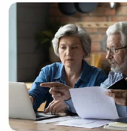
Verifica posizione pensionistica