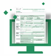
Dichiarazione di successione