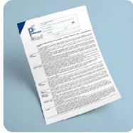
Modello redditi PF