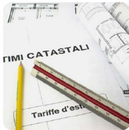
Visure e pratiche catastali