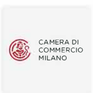
Documenti e visure