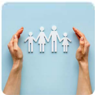
Assegno unico universale

Con la collaborazione di accreditati enti di Patronato, si offre consulenza specializzata per la gestione di pratiche previdenziali e pensionistiche, garantendo supporto completo e personalizzato. L'obiettivo è semplificare i processi burocratici e aiutarti a ottenere ciò che ti spetta, con trasparenza e professionalità.