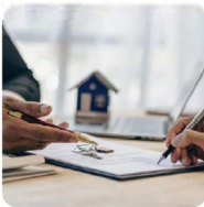
Contratti di locazione