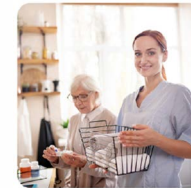
Servizio colf e badanti