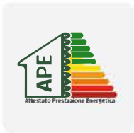
Attestato di prestazione energetica

Ci avvaliamo di studi tecnici professionali e studi legali per un'assistenza completa nella gestione delle proprietà immobiliari, con particolare attenzione agli aspetti amministrativi, contrattuali e fiscali.