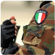
Riscatto leva militare